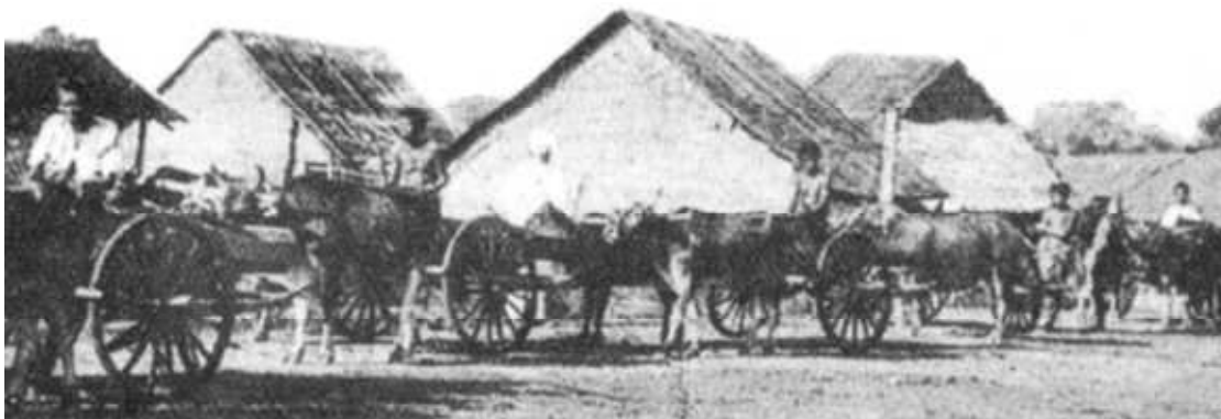
ឆ្នាំ១៨៩១ គេប្រើដីទៅបំពេញដីទំនាបនៅក្នុងក្រុង។ ថ្ងៃនេះគេប្រើដីពីប្រាសាទស្តេចមេកុងទៅបំពេញដីនៅក្នុងក្រុង

Segregation - ការបែងចែកដំបូងសំរាប់ជនជាតិមួយៗស្នាក់នៅ